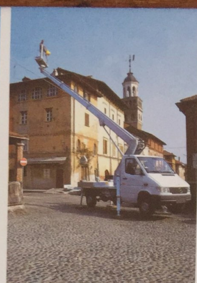
Technische Änderungen vorbehalten! • Soggetto a modifiche senza preavviso